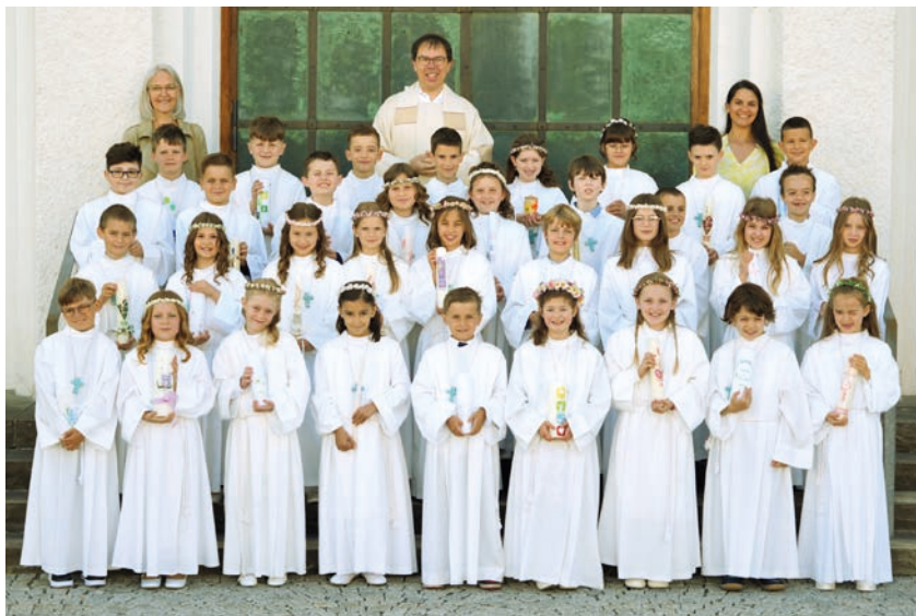
Erstkommunionkinder der Volksschulen Blattur und Berg.

Wir wünschen allen Erstkommunionkindern alles Gute und Gottes Segen!