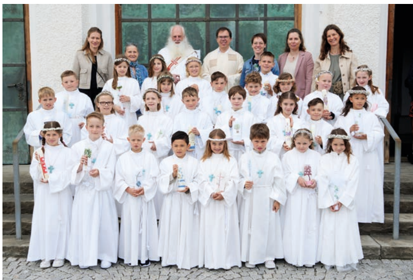
Erstkommunionkinder der Volksschule Markt.